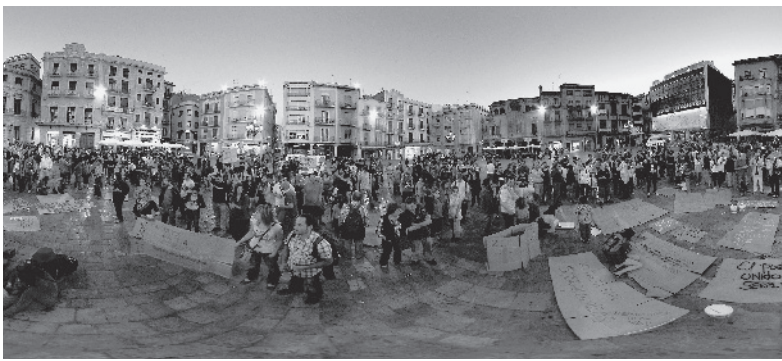
► El entorno y la comunidad donde vivimos determinan nuestra salud