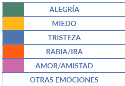
Figura 3. Los códigos de emociones del mapa emocional

Se emplean pósitos de colores, usando la leyenda de la figura 3 : azul-tristeza, naranja-rabia/ira, verde-alegría, amarillo-miedo, rosa-amor/amistad, blanco-otras emociones. Cuando una persona expresa una emoción sentida en un lugar concreto del barrio, esa emoción se localizaba en el mapa y se pone en ese lugar el pósito del color correspondiente 9 tras escribir en él el motivo o la historia de la emoción surgida en ese lugar 9 , entendiéndose el por qué para la persona que lo señala ese activo le genera una u otra emoción.