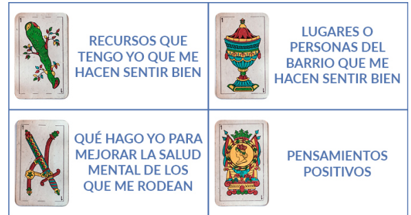
Figura 1. La baraja saludable

La herramienta puede ser empleada para otro tipo de actividades de mapeo de activos, por ejemplo, con la salud en ámbito educativo, salud sexual, alimentación, etc. El ámbito de utilización ha sido grupal y comunitario.