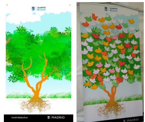
Figura 2. El árbol

Además, se diseñó un mural con forma de árbol (figura 2) —en este caso, un madroño diseñado por un arteterapeuta de Centro Joven—, donde se podían colocar unos pósts con forma de pajaritos con los que se podían compartir AS que nos conectarán personalmente con la vida. Esta es la imagen, al final de la tarde, del árbol en el distrito Centro, cuya carpa estaba ubicada en la plaza de Arturo Barea. El total fueron trece los CMSc que utilizaron el árbol durante el proceso.