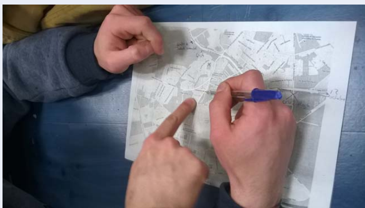
Figura 4. Mapping: intervenciones en institutos