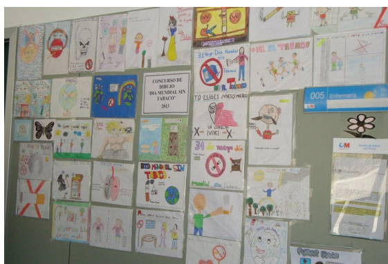
Figura 3. Exposición permanente en el CS Las Olivas de los dibujos con lemas antitabaco Figura 4. Padre e hija con el cartel realizado por la menor