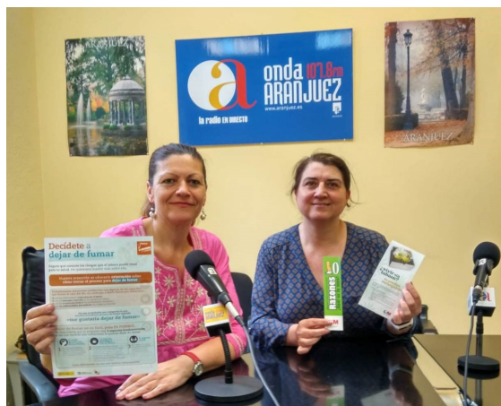
Figura 2. Intervención en la emisora local Onda Aranjuez el 31 de mayo (Día Mundial Sin Tabaco)

emisora local e informamos y sensibilizamos a la comunidad de los temas que nos demandan en todas las etapas de la vida. Por ejemplo, el Día Mundial Sin Tabaco acudieron una técnica de salud pública, una enfermera y una especialista en Medicina Familiar y Comunitaria del CS Las Olivas, donde informamos a la población de los efectos nocivos del tabaco y animamos a los fumadores a iniciar deshabituación tabáquica desde la Atención Primaria de Salud. Y siempre llamaban por teléfono «pacientes activos» exfumadores que contaban su experiencia de cómo dejaron de fumar con nuestra ayuda y animaban a la población a abandonar el consumo informándoles de que a ellos, al hacerlo, les ha mejorado su calidad de vida.