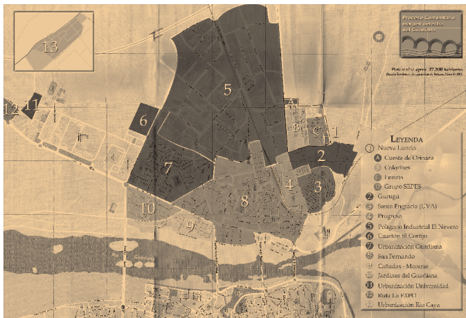
Figura 1. Barrios de la margen derecha del Guadiana.

y administración local) y muchas y diferentes organizaciones de la llamada «sociedad civil» (sindicatos, organizaciones empresariales, ONG, etc.) que, de manera abierta y pública, aportan lo que consideran posible y oportuno, desde una total autonomía, compartiendo finalidades y protagonismo entre todas. Este apoyo queda representado en la constitución de la Comisión Institucional de Seguimiento (CI) y en la firma del Reconocimiento del trabajo de coordinación de los recursos técnicos en el PCMDG.