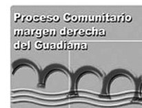
PROCESO COMUNITARIO MARGEN DERECHA DEL GUADIANA (PCMDG)

procesocomunitario.mdg@gmail.com procesocomunitario-mdg.blogspot.com Teléfono: 924 00 18 78-650 51 92 38