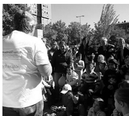
► Taller de salud bucodental en el barrio de Entrevías-El Pozo, organizado por el equipo del CMS de Puente de Vallecas (octubre de 2010)