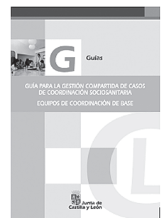
➤ Portada Guía para la gestión compartida de casos de coordinación sociosanitaria