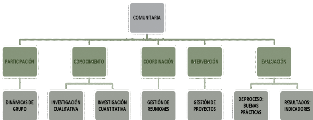
Figura 2. Esquema de fundamentos metodológicos del PACAP

En los siguientes módulos iremos ampliando y relacionando cada uno de los temas y los conceptos que consideramos necesarios para entender y mejorar nuestra capacidad para participar correctamente en grupos, comunidades, actividades y procesos.