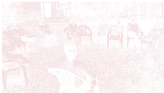
↑ Proyecto Salud Comunitaria de Guarjila-Chalatenango, San Salvador

HA SIDO UNA OPORTUNIDAD INOLVIDABLE DE PODER PARTICIPAR EN EL TALLER Y CONVIVIR CON UNA AMPLIA REPRESENTACIÓN DE EXPERTOS EN LA MATERIA DE ATENCIÓN PRIMARIA EN SALUD DE LOS PAÍSES DE AMÉRICA LATINA Y DE OTROS CONTINENTES