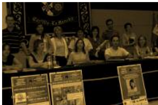
↑ Participantes en las jornadas