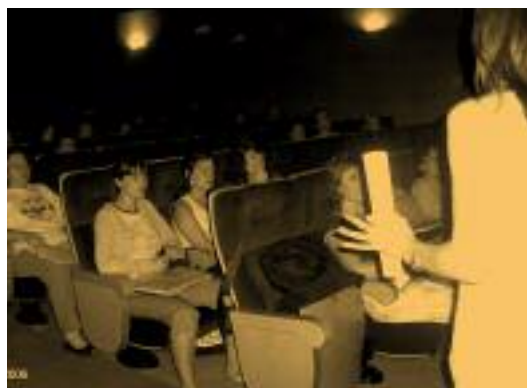
↑ Un momento de las jornadas

gos, acercándonos a los espacios que los Jóvenes comparten, asociaciones, comunidad escolar, comunidad universitaria, etc., intentando rescatar a quienes se ven afectados por dinámicas de exclusión social (absentismo escolar, nula participación social, etc.), ya que la integración en una comunidad “sana” es la mejor forma de prevenir los problemas de salud (entre otros muchos), en los jóvenes.”Sobre el hecho sexual humano o cómo atender todas las sexualidades en Atención Primaria”