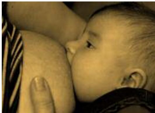
↑ Promoción de la lactancia materna

Aunque este aspecto es una asignatura pendiente, ya que ni a los profesionales de Atención Primaria se les ha dotado de recursos adecuados (a pesar de que se les exija en muchas ocasiones), ni es una cobertura habitual ofertada por autoridades deportivas (ya sea del ámbito municipal, regional o nacional). Es, por lo tanto, preciso recomendar dirigirse a los expertos en medicina, fisioterapia y enfermería deportiva para realizar una valoración adecuada teniendo en cuenta que no es una prestación financiada por el Sistema Nacional de Salud. Es un reto de las autoridades sanitarias y deportivas facilitar el acceso a esta prestación.