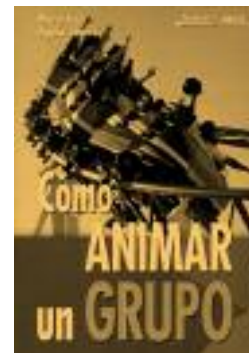
↑ Manual de atención grupal

LA ACCIÓN CIUDADANA, INDIVIDUAL O COLECTIVA, ENRIQUECE LA ACCIÓN PÚBLICA, DEMOCRATIZA LAS DECISIONES, LEGITIMA LA DEFINICIÓN DE PRIORIDADES Y MEJORA LA ASIGNACIÓN DE RECURSOS