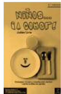
↑ Portada de Niños... ¡a comer!

VIVIMOS EN UNA SOCIEDAD MATERIALISTA Y CONSUMISTA EN LA QUE EXISTE EL PELIGRO DE “DESVINCLARSE”