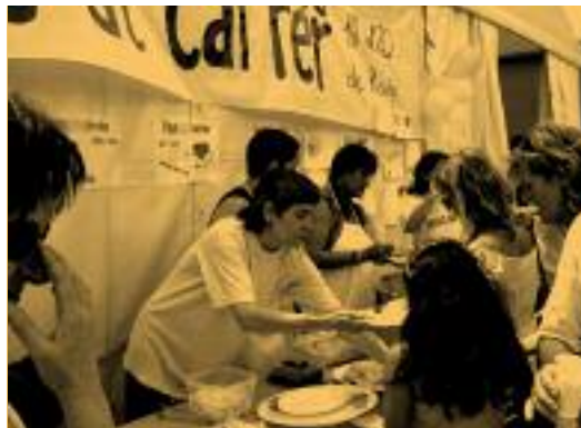
↑ Muestra-degustación de cocina saludable.

La Comisión de Trabajo Interinstitucional de El Carmel (CTIC) empezó a consolidarse en el año 1997 gracias a los profesionales de trabajo social de AP de distintos servicios del barrio: centro de Atención Primaria, centro de Servicios Sociales y Cáritas (gestor del programa público de atención social a personas mayores de pensiones mínimas). Esta comisión nació de la necesidad de coordinar los servicios sociosanitarios para la atención de los casos individuales. Los objetivos de la CTIC circunscritos a la problemática relacionada con el envejecimiento son, básicamente: definir líneas prioritarias de intervención según las necesidades detectadas, proveer una atención coordinada de los diferentes servicios e implicar a la población para encontrar respuestas a las problemáticas que la