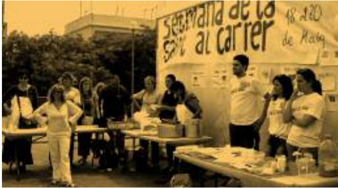
↑ Setmana de la Salut al carrer

resto del equipo al no estar la orientación comunitaria valorada suficientemente. Esta aproximación a los problemas de salud de la población, sin embargo, se mantuvo actualizada periódicamente y se empleó como instrumento formativo para los residentes de la especialidad, estudiantes de enfermería y de trabajo social, a su paso por el CS. La información sobre las opiniones de la propia comunidad se recogió a través de un estudio cualitativo con grupos focales acerca de los principales problemas que la afectan. El trabajo de campo para este estudio cualitativo nos permitió establecer contactos e iniciar una relación de intercambio con algunos grupos de población. Los nuevos datos se fueron incorporando periódicamente al análisis y en el año 2004 la posibilidad de participar en un proyecto de barrio (véase más adelante) nos dió el impulso necesario para avanzar finalmente en la priorización de un problema de salud. Esta priorización se llevó a cabo tras un proceso de discusión interna y con los representantes del proyecto de barrio citado. El problema de salud elegido fue la obesidad infantil y llegados a este punto se decidió abordarlo de la forma menos medicalizada posible, por lo que se redefinió como “hábitos alimentarios inadecuados y falta de ejercicio físico en los niños y jóvenes del barrio de El Carmel”.